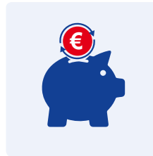
Modellrechnung mit 50.000 Euro Beitrag.

Bonus und Altersvorsorge Fonds im Vergleich.