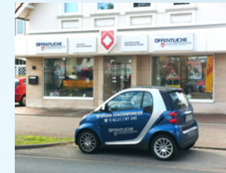
Hier finden Sie uns